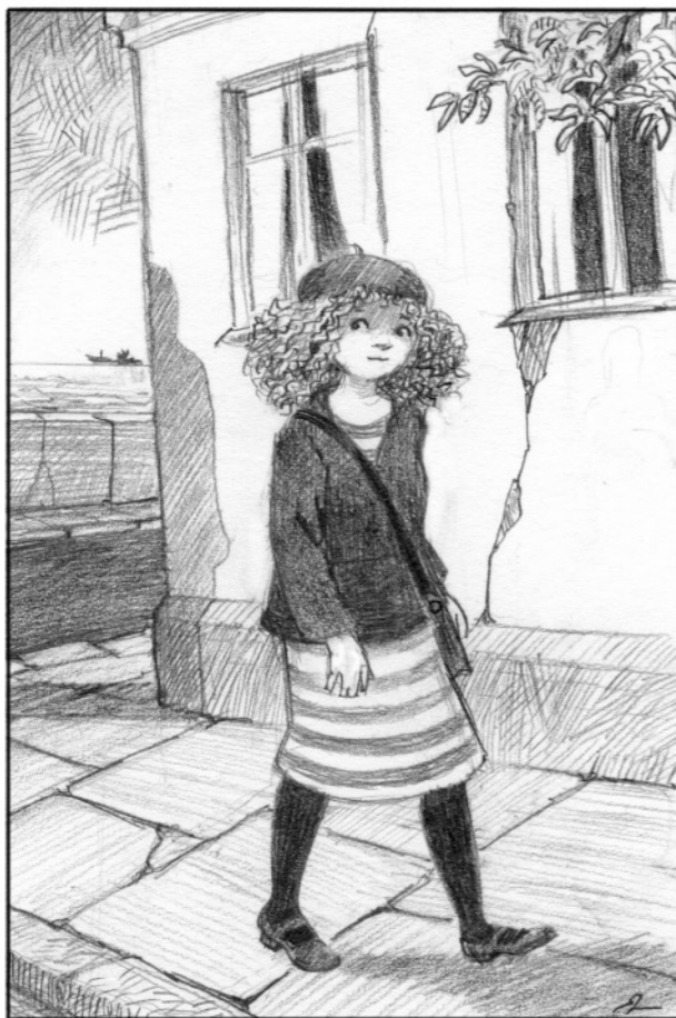
Känslan följde henne till arbetet...