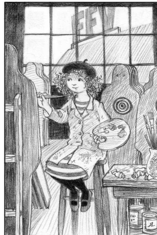
...men släppte när hon fick ägna sig åt konsten.