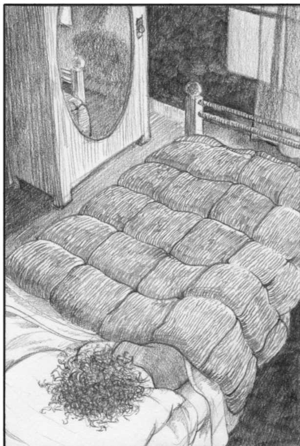
Hon hade en obehaglig dröm.