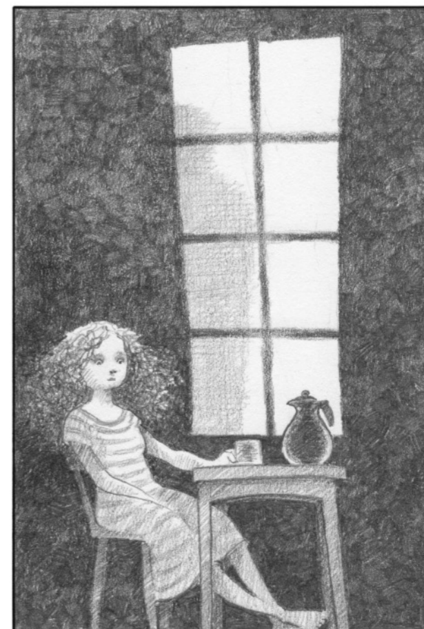
... rent av kontrollerad.