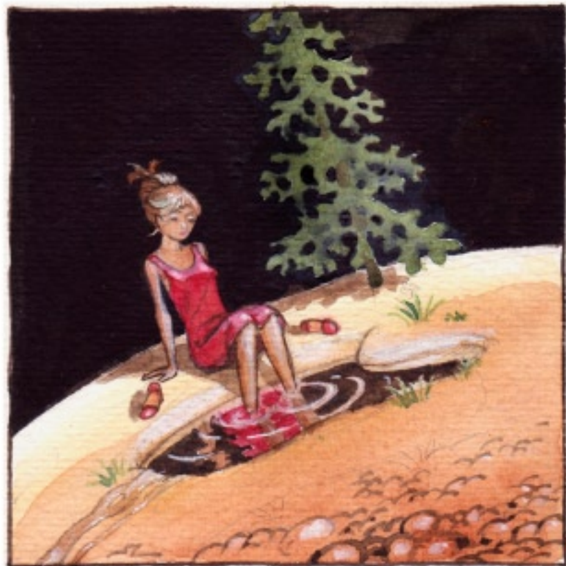
Mycket hade förändrats.