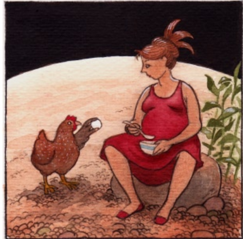
En omvittnat duktig och pliktrogen sort.