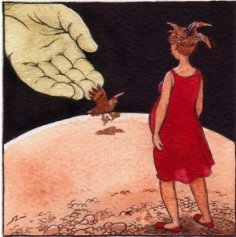
Det kom en höna. En Barnewelder.