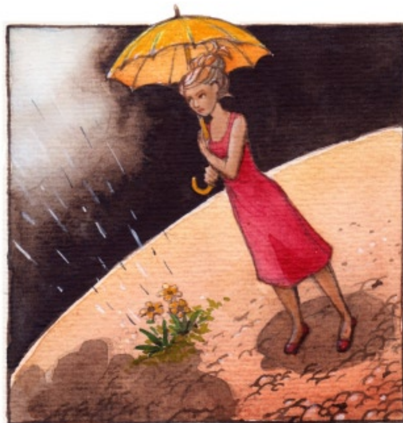
Klimatet var annorlunda.