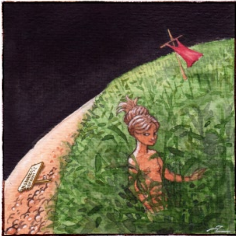
Ett majsfält stod kvar. Sam tyckte om att smyga omkring naken i bland de höga axen.