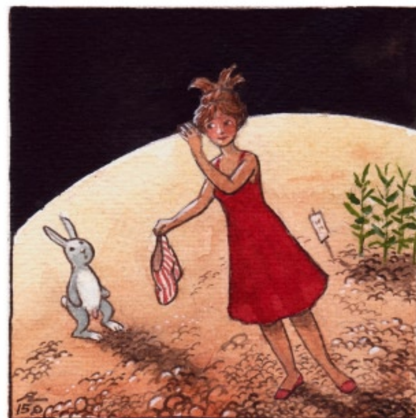
Sam hade ingenting emot sällskapet, men en gnutta anständighet var ett krav.