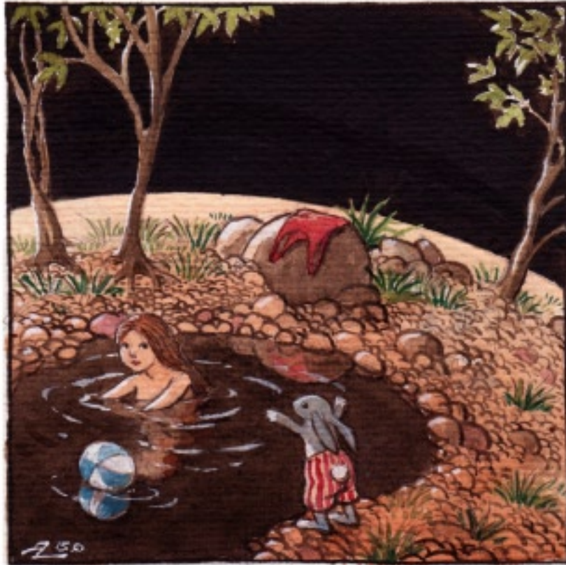
Båda tyckte om ett kvällsbad i dammen.