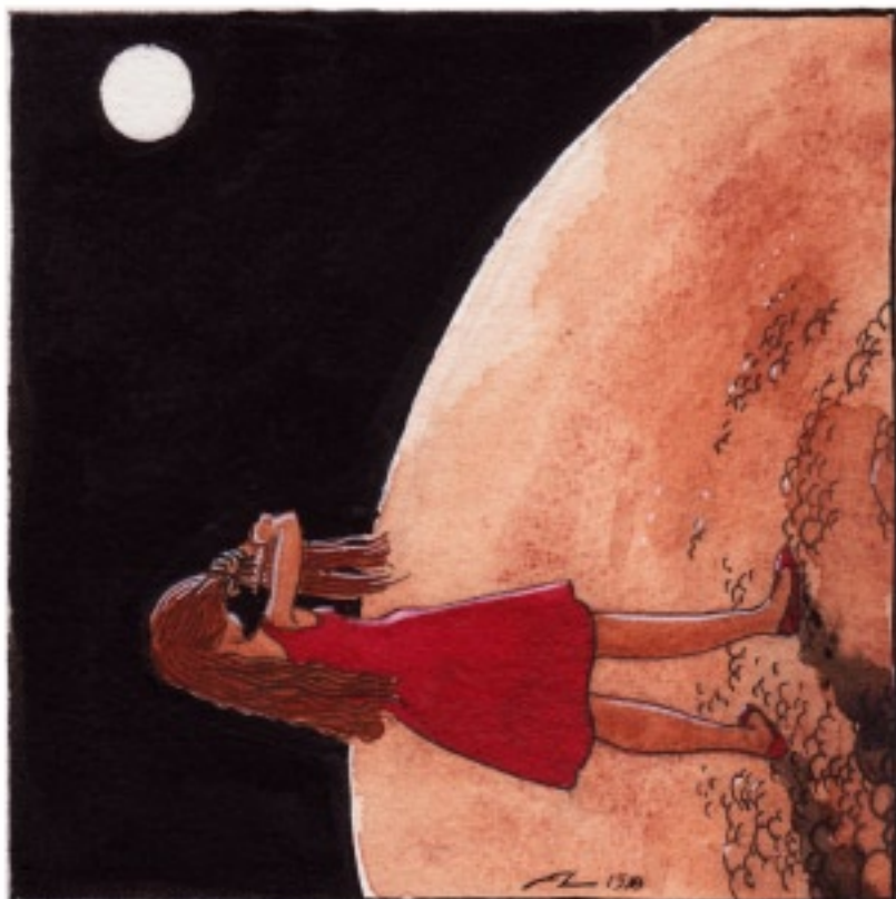
Månen höll sällskap vid kvällstoaletten...