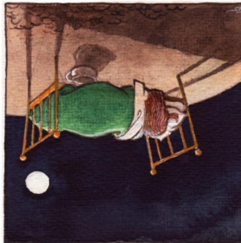
...och vakade medan hon sov.