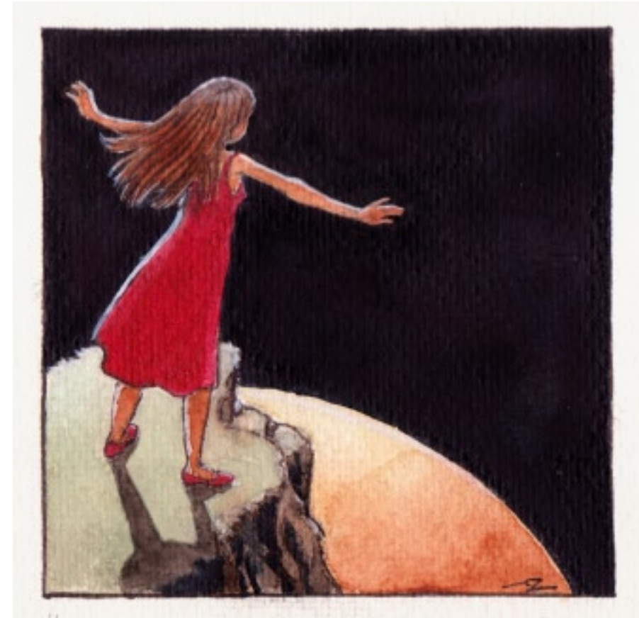
Uppe på höga berg kunde hon känna sig som en mås över Jorden.