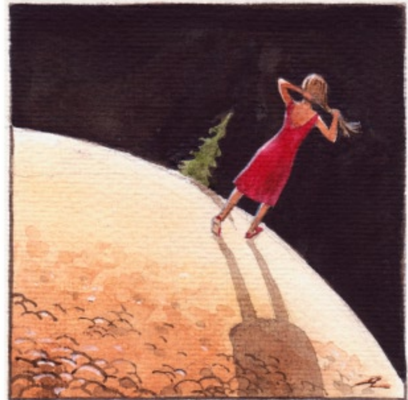
Och hon njöt verkligen av lugnet där hon gick.