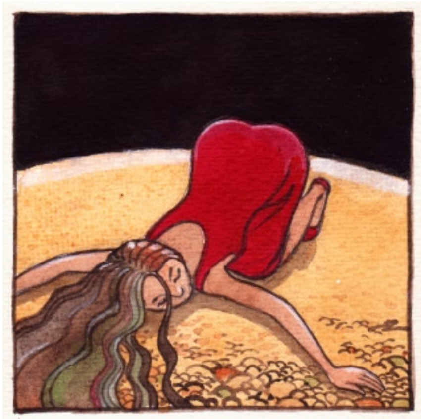
Men hon älskade sin jord – och stillheten.