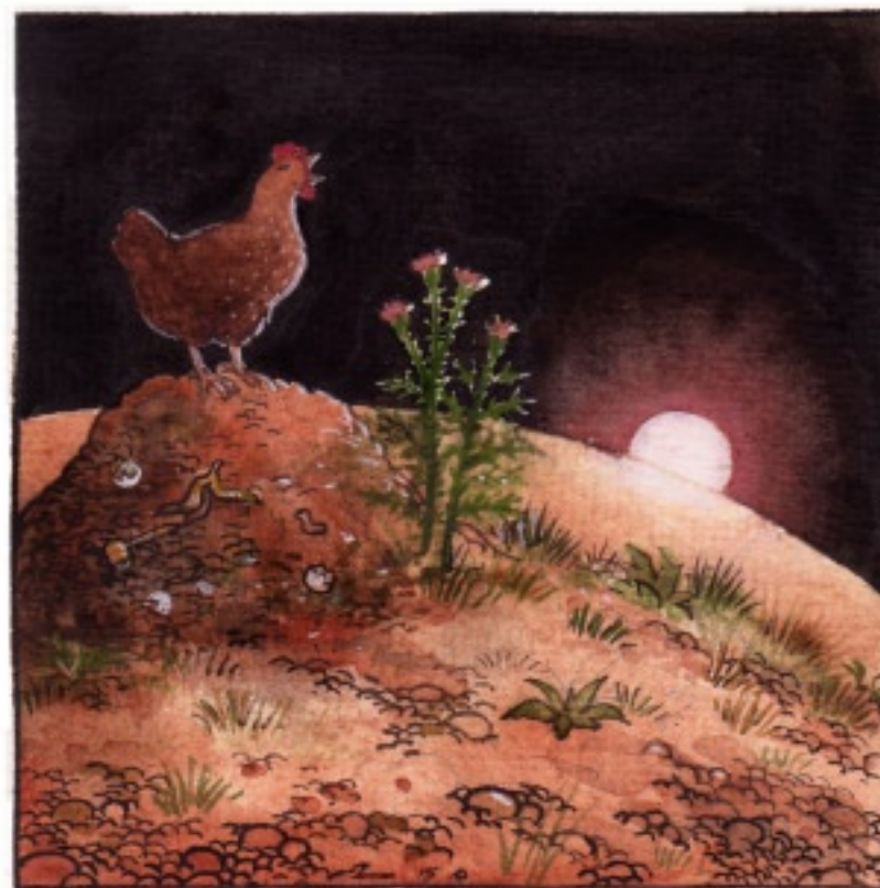
Hönan tog sig rollen som tupp. Lite skorrig men inte helt oäven.