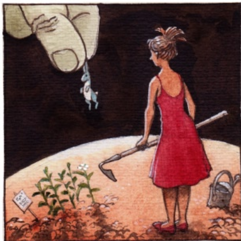
En dag kom en kanin. Han hette Joy.