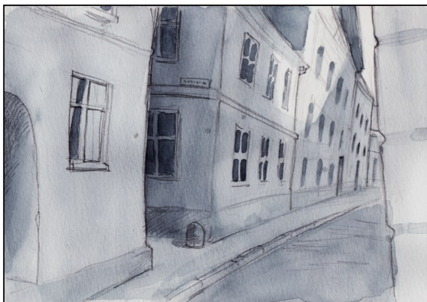
Dessa kände jag väl.