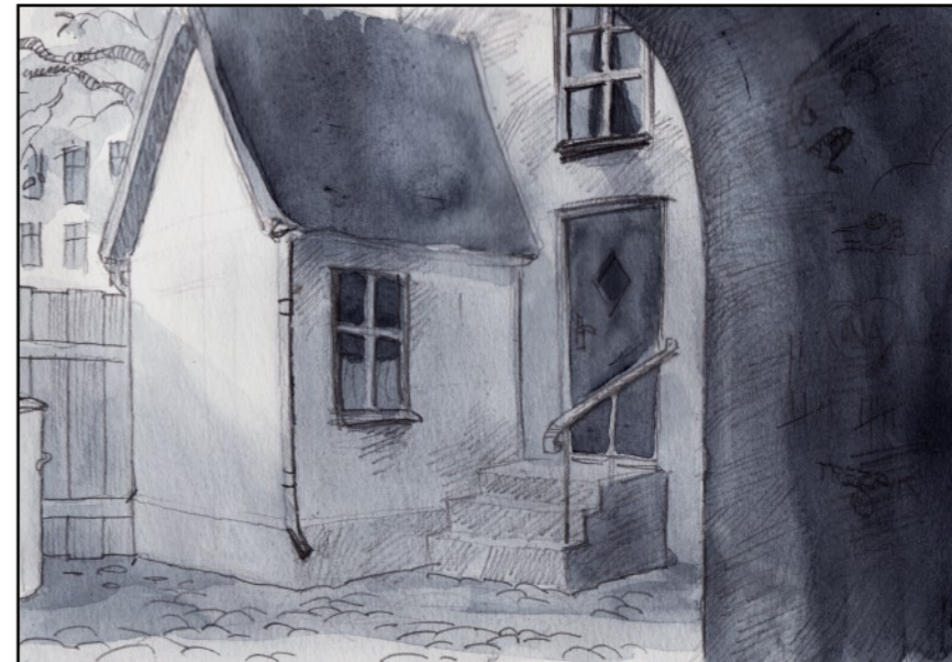
Till höger fanns ett outhyrt gårdshus.