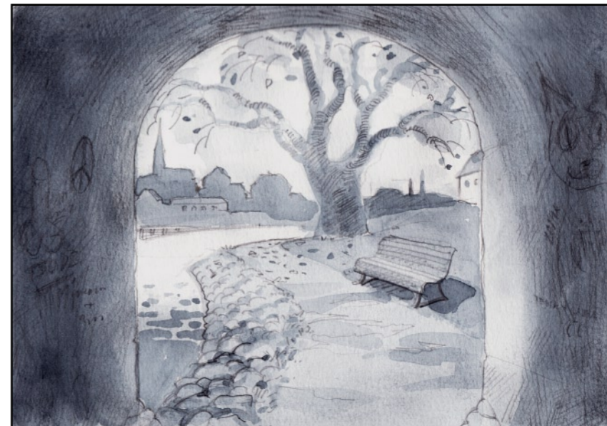
Stan föreföll mig så eländigt grå.