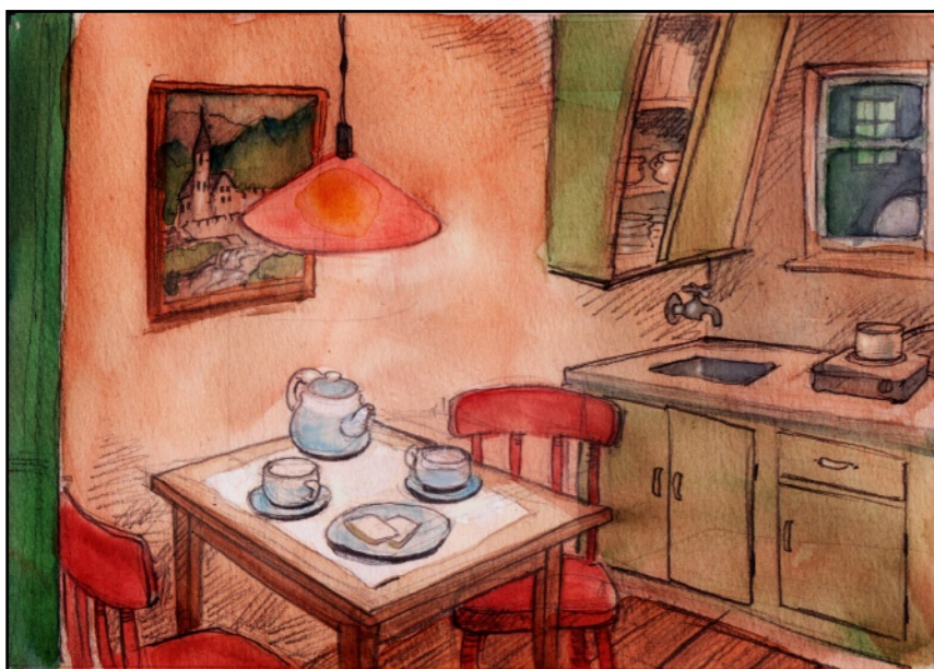
Hon skulle resa...