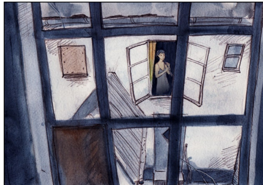
En dag hörde jag musik.