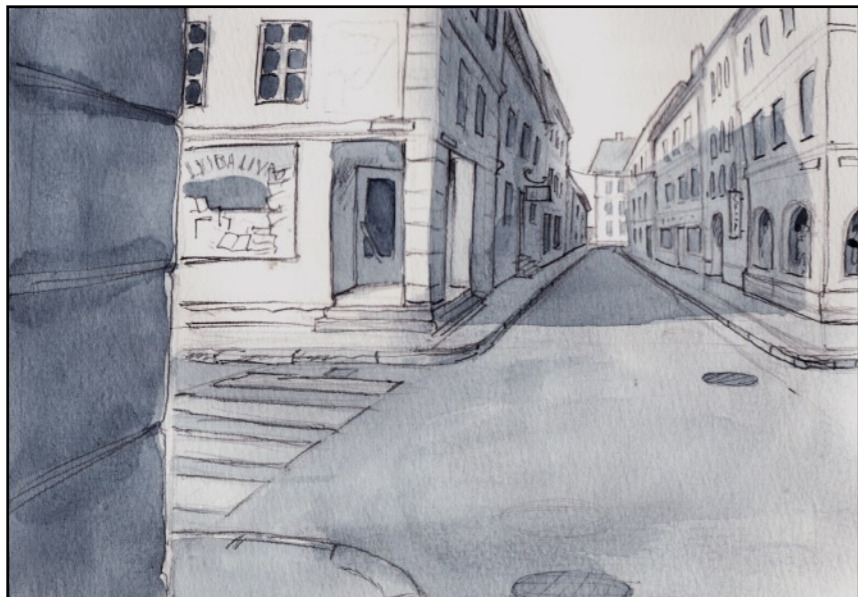
...på trista gator.