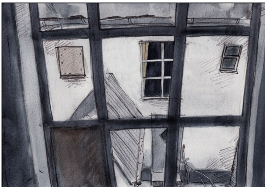
En ganska nedslående vy.