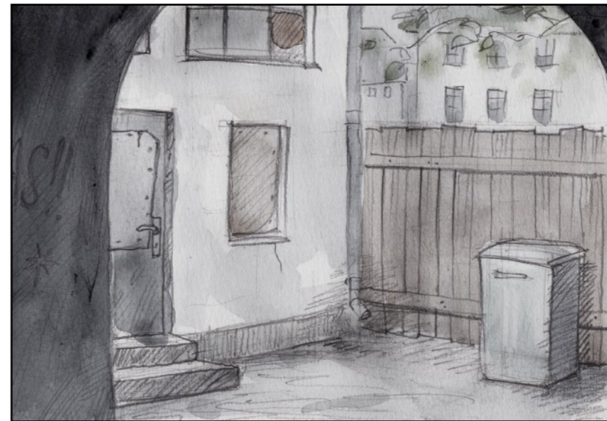
Ruffigt, men jag hade inte råd med bättre.