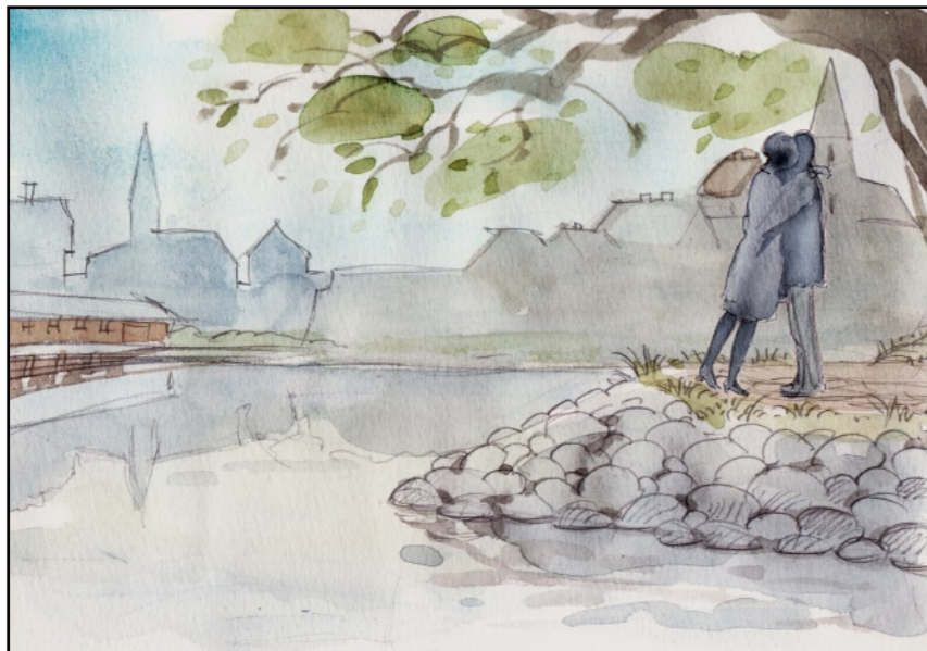
Hon kysste mig som svar.