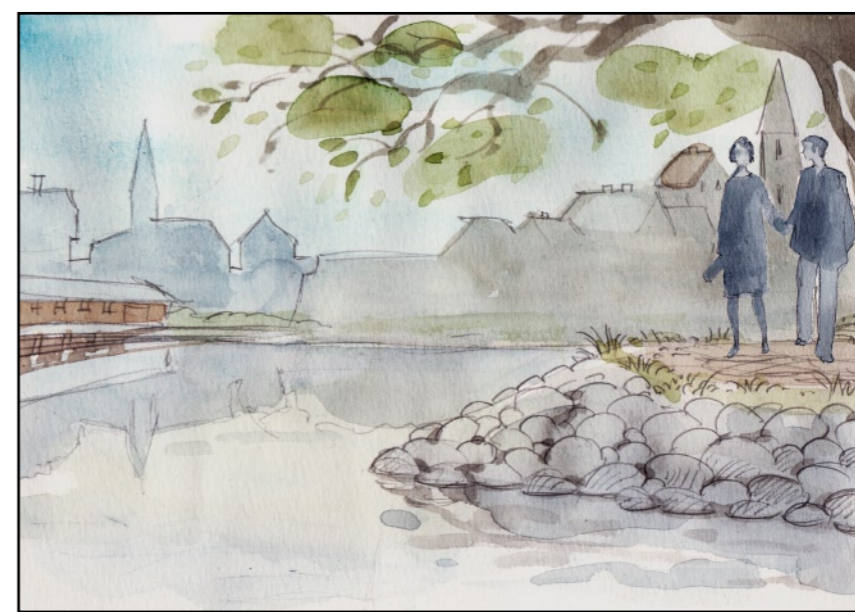
Jag undrade om vi skulle ses igen.