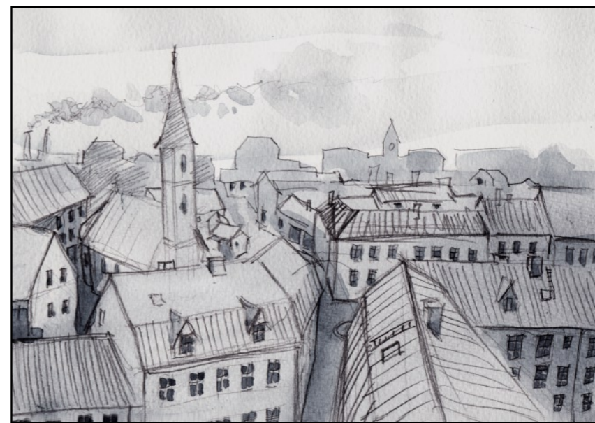
Jag bor kvar i stan ännu fast den förefaller mig så eländigt grå.