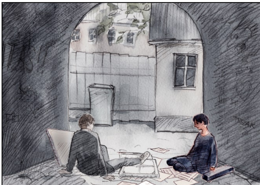
...och jag var sen med att flytta på mig.