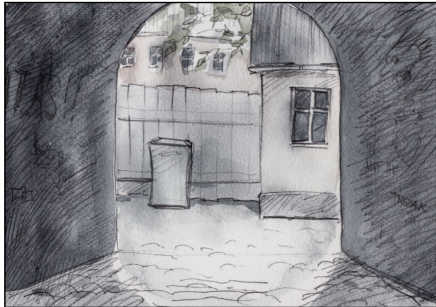
...till vänster in på gården.