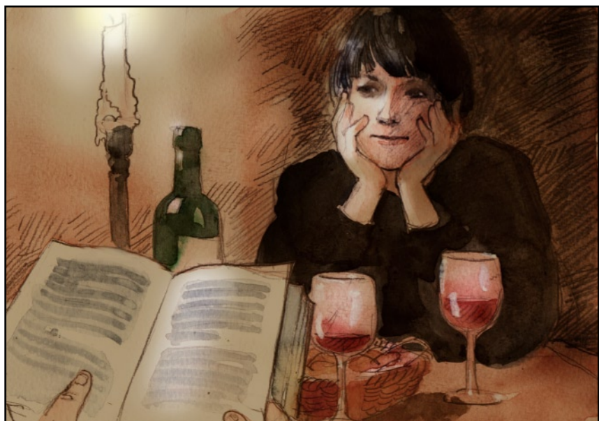
Hon bad mig högläsa hennes favoritpoem.