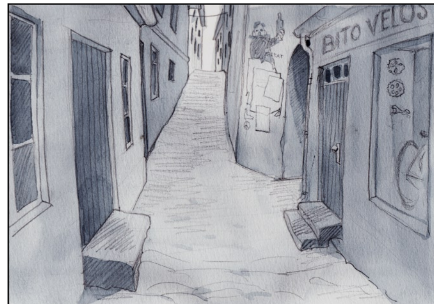
Deras hopplöst slingrande meningslöshet.