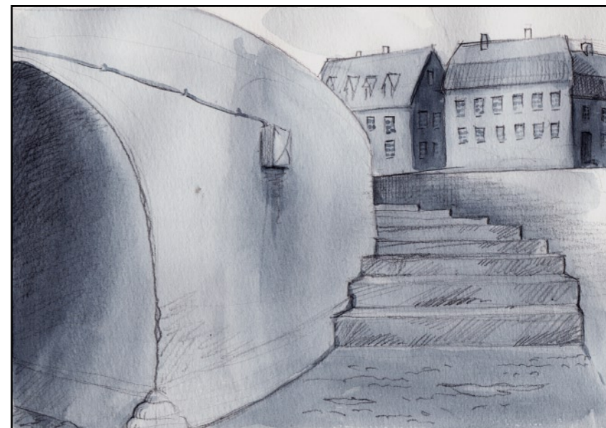
Jag gick mina promenader...