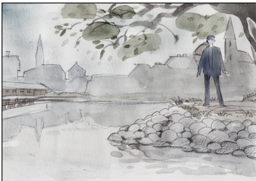
...och skyndade iväg.