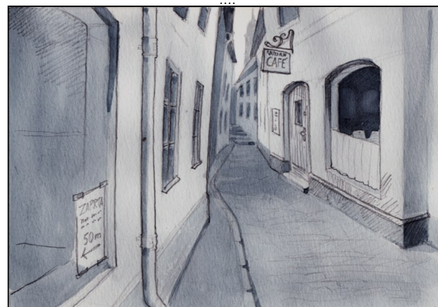
Tomma och håglösa som jag själv.