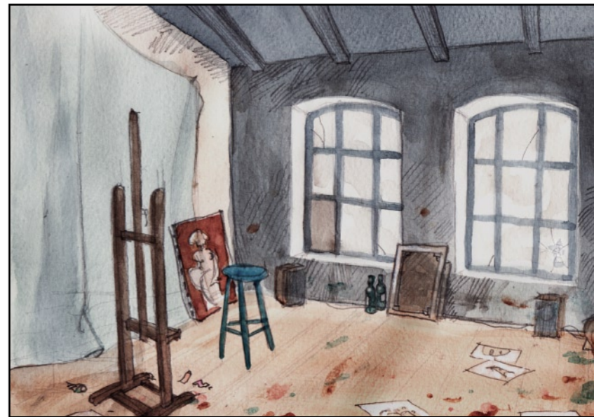
På eftermiddagen knackade hon på min dörr.