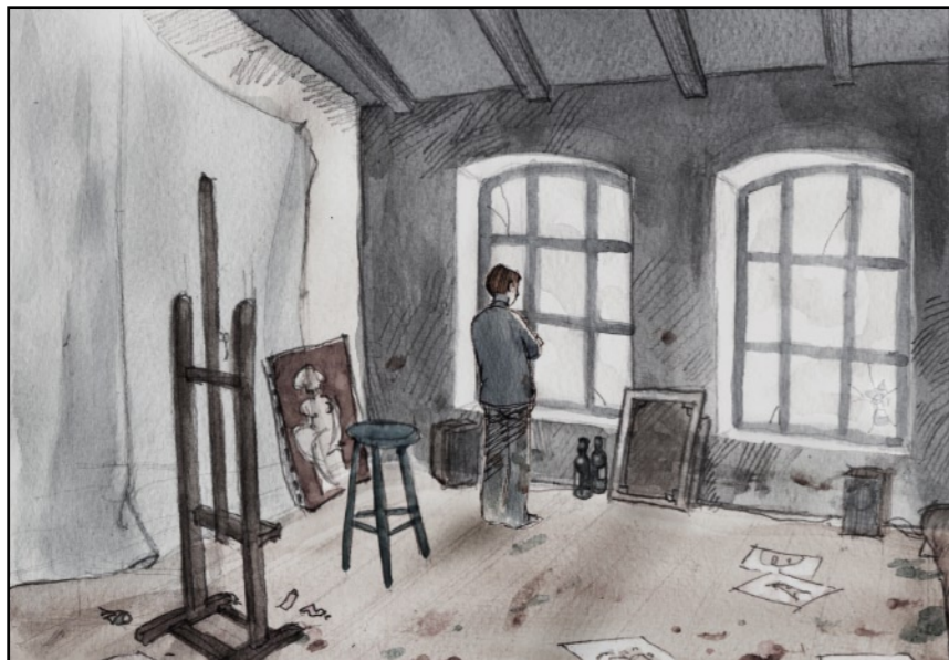
Det var var min utsikt.