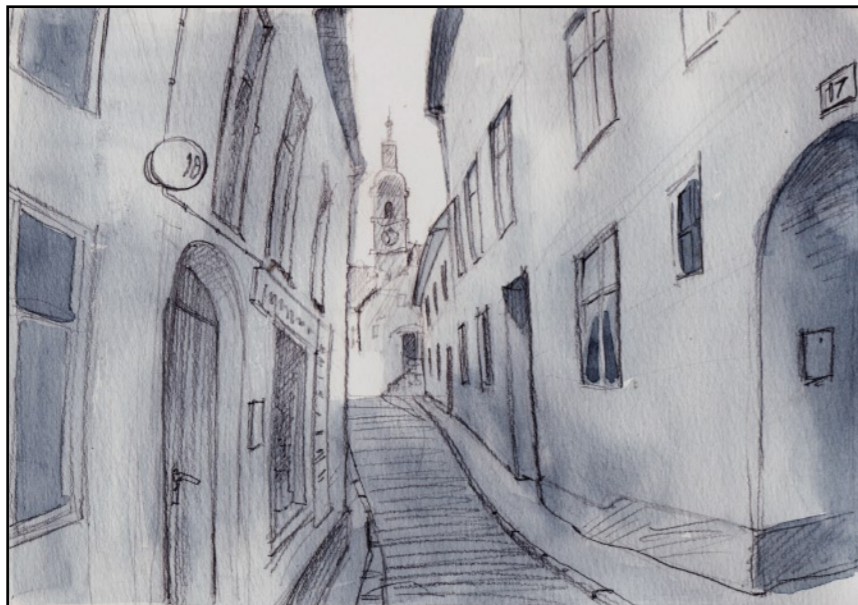
Jag hyrde min lokal i nummer 17...