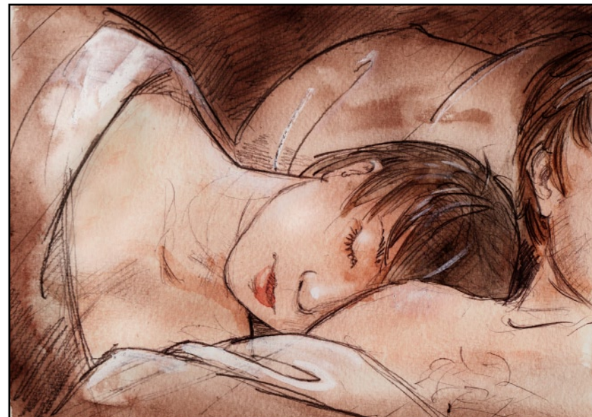
Det blev sent innan vi somnade.