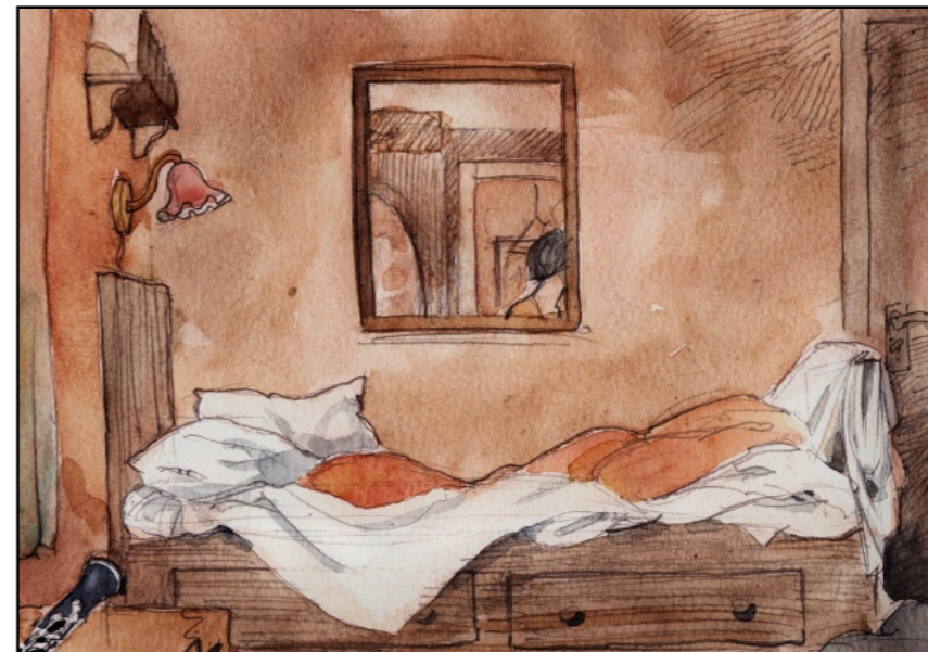
...och jag föreslog följa ett stycke på vägen.