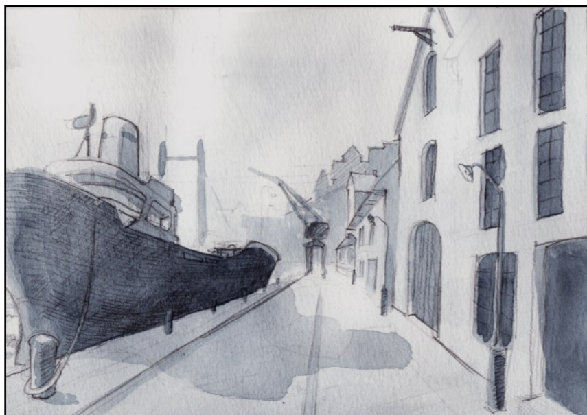
Någon annan anledning att vistas här fann jag inte.