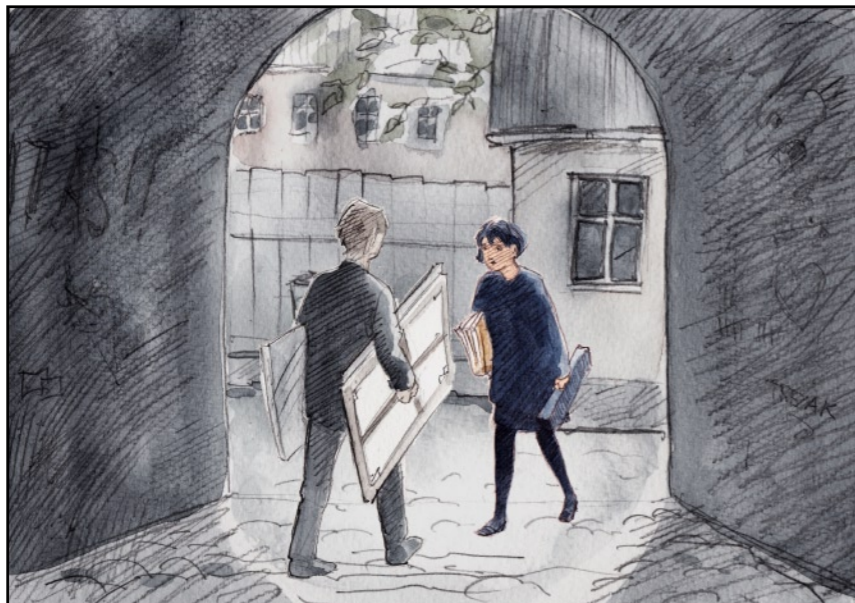
Hon hade bråttom...