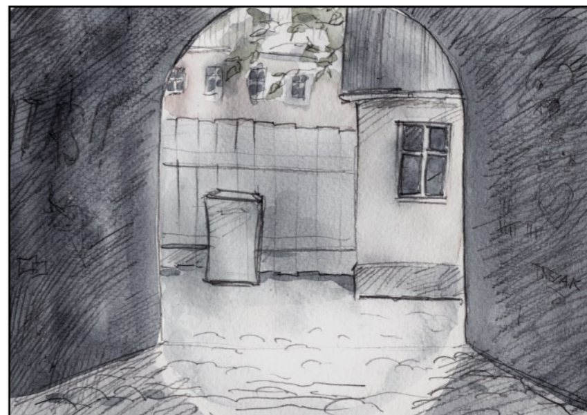
Händelsevis stötte jag ihop med den nya hyresgästen.