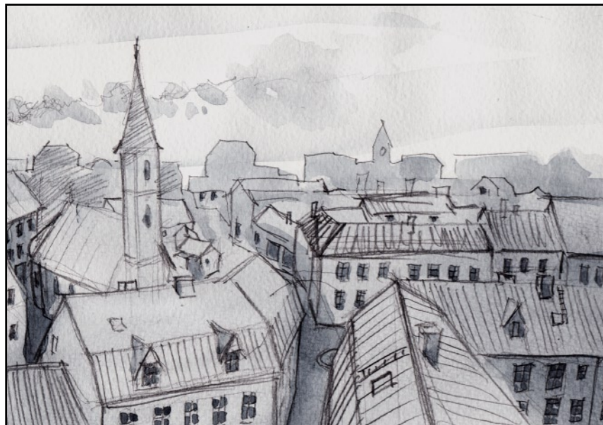
Jag bodde i stan under mina studier.