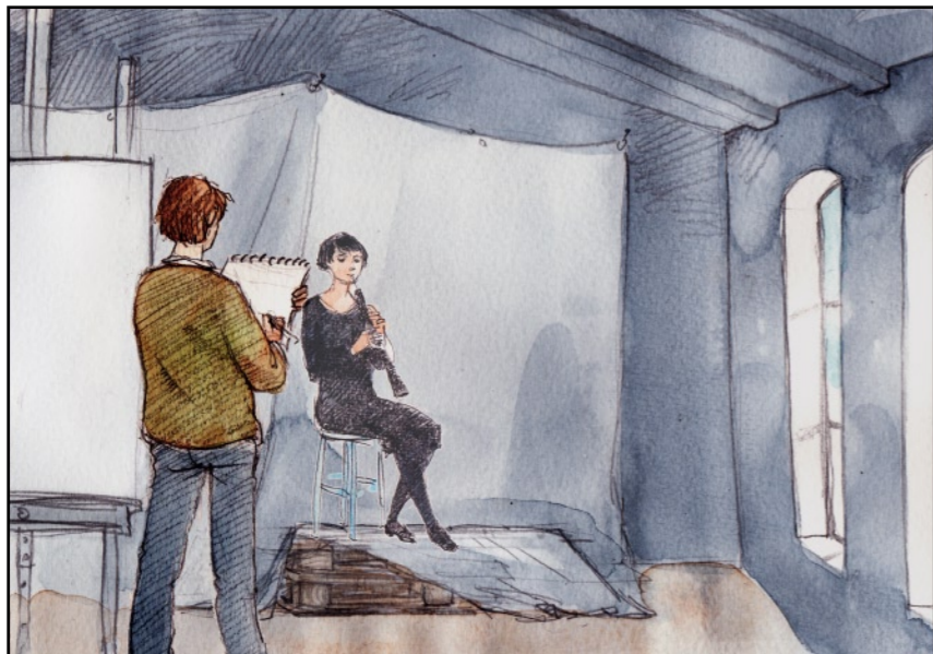
Hon ville att att jag skulle porträttera henne.