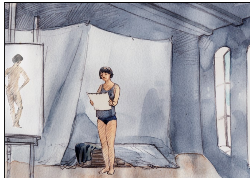
Hon tyckte att vi borde äta middag tillsammans...