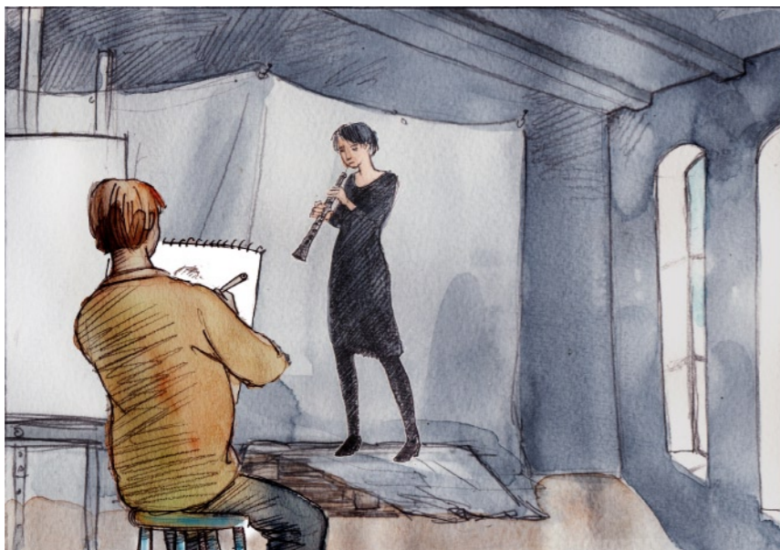
Under tiden övade hon på sin stämma.