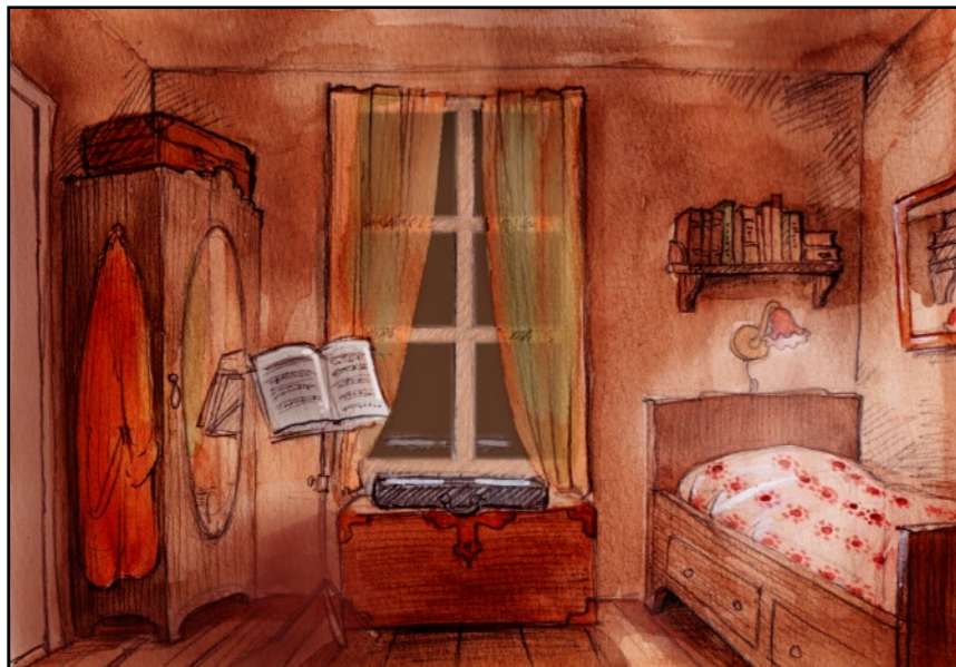
...nere hos henne.