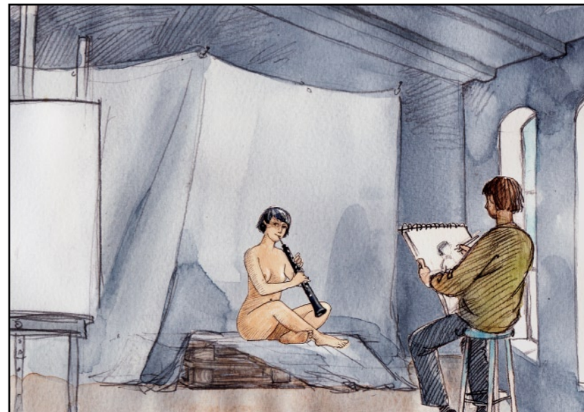
Hon var inte alls blyg.