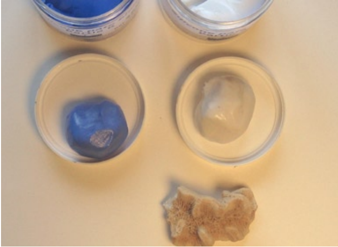
Tag lika delar blå och vit silikonmassa.