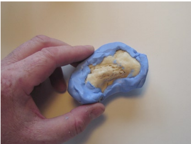
Forma snabbt massan kring objektet du vill kopiera...