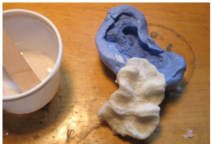
Här är fossilkopian gjuten i Polyuretanharts.