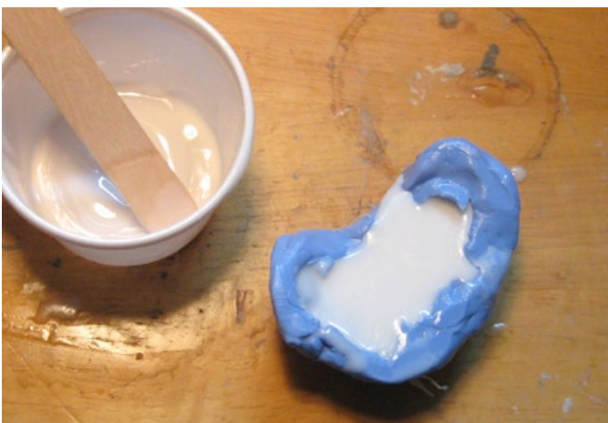
Väl hemma igen kan du i lugn och ro göra en avgjutning.